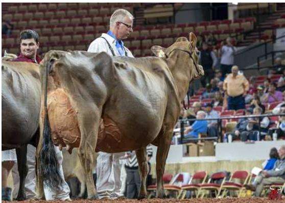
AVONLEA PREMIER CHOCOLATE CHIP DAM