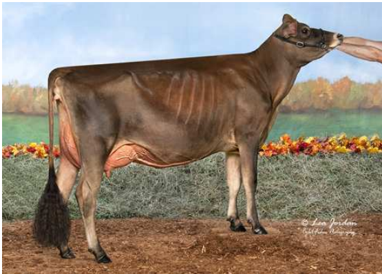
MISH-RO VIP SHABBAT SHALOM

CHILLI ACTION COLTON TJ CLASSIC MINISTER VENUS EX-95%-8YR-USA SELECT-SCOTT MINISTER STEPHAN SPARKLER VERA EX-95%-9YR-USA GIL-BAR UNIQUE SPARKLER PIEDMONT RENAISSANCE VIVIAN EX-91%-4YR-USA