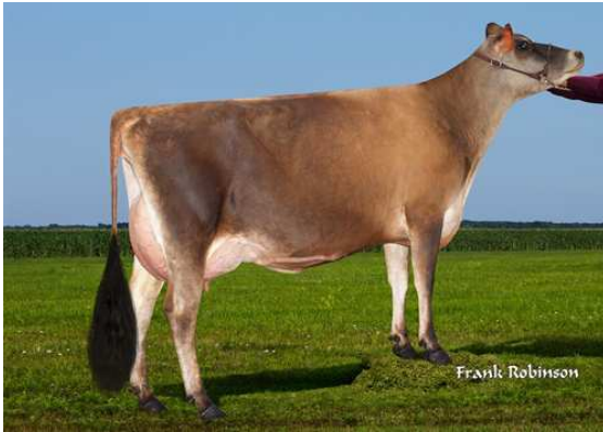
AHLEM CHANGE UP MAGGIE 52063

AHLEM GENOMINATOR SHAN-MAR HILARIO CHARLEY VG-87%-3YR-USA CAL-MART RENEGADE HILARIO SHAN-MAR LEGAL CHARISMA EX-91%-8YR-USA TOLLENAARS IMPULS LEGAL 233 SHAN-MAR LEGACY CARISSA VG-86%-4YR-USA