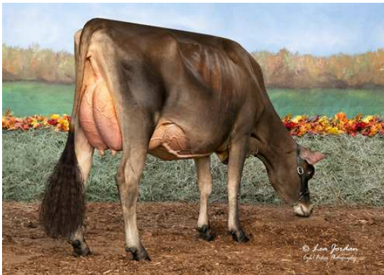
MISH-RO VIP SHABBAT SHALOM