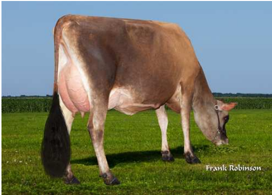
AHLEM CHANGE UP MAGGIE 52063