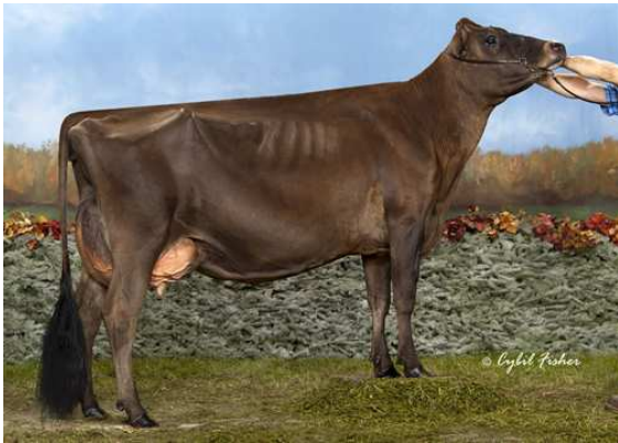
AVONLEA KOOKIE DOUGH GRANDDAM