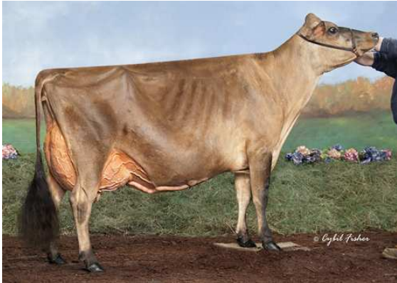
AVONLEA PREMIER CHOCOLATE CHIP DAM